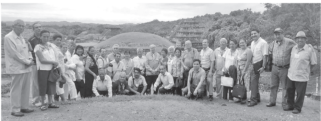
Convención de cronistas de Veracruz durante la visita a Tajín.

Hay falta de coherencia, despiste, falta de imaginación, increíbles en los novelistas que respondieron la pregunta. Ni modo, así son.