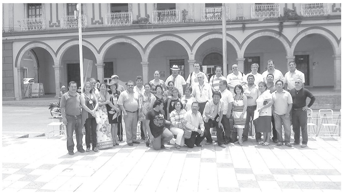
Asistentes al Festival literario en Tlapacoyan, el 26 y 27 de abril de 2014.

Javier Marías: "Escribo para no tener jefe". Conflicto con la autoridad y en consecuencia con la figura paterna. Luisgé Martín: "Porque puede que así comprenda la razón por la que estoy tan, tan enfadado