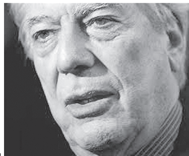
Mario Vargas Llosa.

El tema, decíamos, merece una crónica amplia y detallada, tanto de la visita de Mariano a Tlapacoyan, como de los sucesos que la rodearon. Tal vez en la semana quede lista, para aparecer como la crónica del próximo lunes. Es lo menos que este cronista debe a su amigo Mariano Mores.