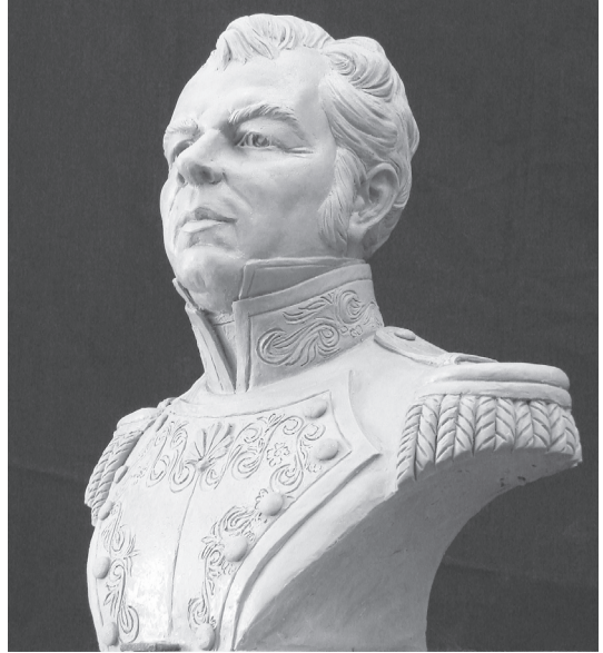
MOLDE DEL BUSTO DE GUADALUPE VICTORIA , que donará el Congreso de la Federación a Tlapacoyan. El final ya está elaborado.

* Gira de trabajo con presentaciones del libro ya