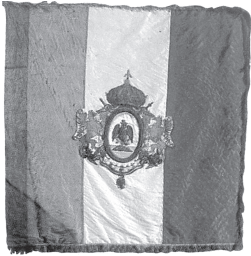
Bandera de México en 1865, bajo el emperador Maximiliano de Habsburgo.

De 500 hombres con los que contaba el general Ignacio Alatorre para defender Tlapacoyan, sólo sobrevivieron 100, aunque contando las bajas de los voluntarios de la población resultaron muertos 268; 82 heridos y 202 hechos prisioneros, lo que arroja un total de 552 bajas del lado de los defensores de Tlapacoyan.