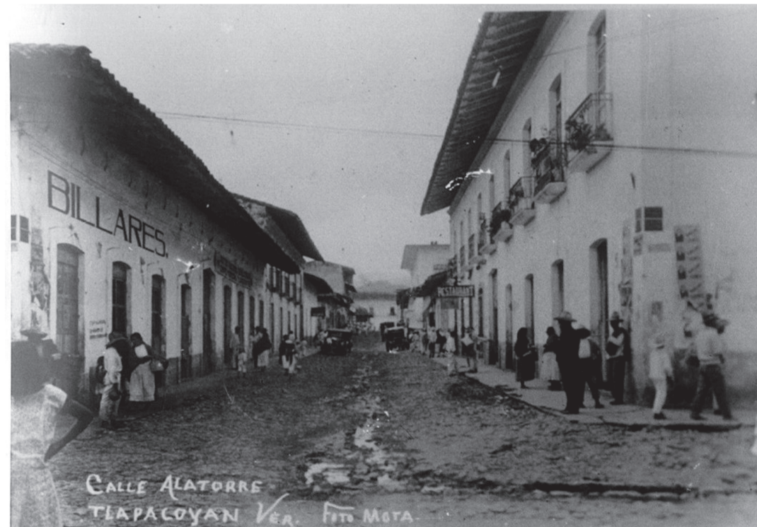
GUADALUPE VICTORIA EN UN POCO conocido retrato, con la banda presidencial.