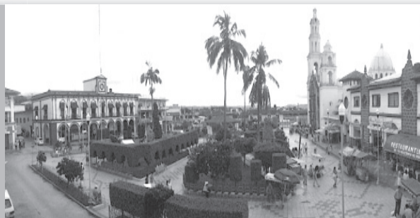
Gráfico DE MARTÍNEZ DE LA TORRE CRÓNICAS de Tlapacoyan