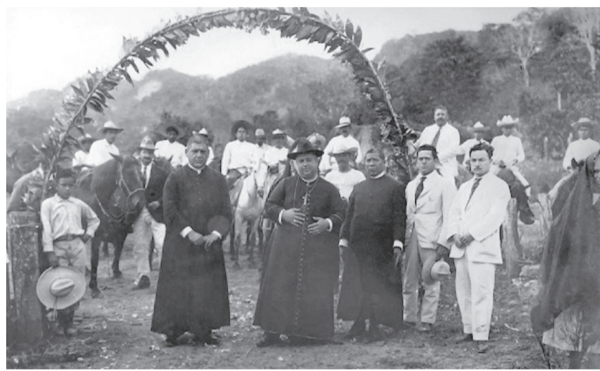
Quando Guízar y Valencia visitó El Jobo recibió diversos homenajes.

Rafael Guízar y Valencia fue beatificado por el papa Juan Pablo II el 29 de enero de 1995 y canonizado por el papa Benedicto XVI el 15 de octubre de 2006. Fue el primer obispo mexicano que recibió tal distinción. Curiosamente, el papa que lo nombró obispo fue Benedicto XV y el que lo canonizó, 87 años después, Benedicto XVI.