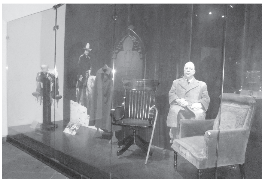
El museo dedicado a Rafael Guízar y Valencia, en Xalapa, no tiene casi visitantes, debido a la poca publicidad que se le ha hecho.

Las fotos en la portada de este libro son, de izquierda a derecha y de arriba a abajo: 1.- El emblema masónico del grado 33, de Guadalupe Victoria, el águila bicéfala. 2.- Una foto del primer presidente en una postal. 3.- La hacienda El Jobo con la iglesia de San Joaquín, al fondo, el 16 de agosto de 1923. 4.- Medalla Guadalupe Victoria, cuando tomó posesión. 5.- Monedas con que se pagaba en El Jobo. 6.- La banda masónica de Guadalupe Victoria. 7.- Maximino Ávila Camacho. 8.- Guadalupe Victoria. 9.- "La llave" para descubrir los secretos de Guadalupe Victoria en el libro. 10.- Otra medalla del que fuera primer presidente de México.