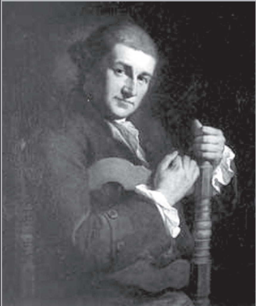
David Garrick fue un actor inglés que nació el 19 de febrero de 1717 y murió el 20 de enero de 1779, un mes antes de cumplir 62 años de edad. Al final, su vida se parecía a la del payaso de la ópera Pagliacci, que hacía reír, aunque el dolor lo consumía por dentro.

Bill Gates, por su parte, no tiene porqué preocuparse si Windows, ya en consecuencia desaparece, van para abajo, ya es accionista de una empresa productora de computadoras que sigue para arriba: Apple, que produce la Macintosh, el iPod, el iPad, el iPhone y ahora el Apple Watch, un reloj-teléfono que cumple con ambas funciones y mucho más.